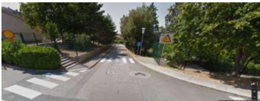
Pot v gaj