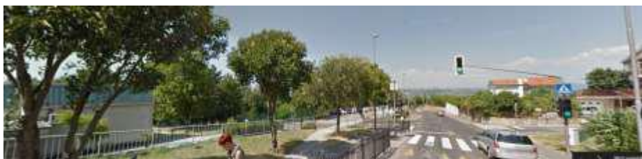
Ulica Vena Piona – križišče pred šolo in semaforiziran prehod za pešce s talno oviro za umirjanje prometa.