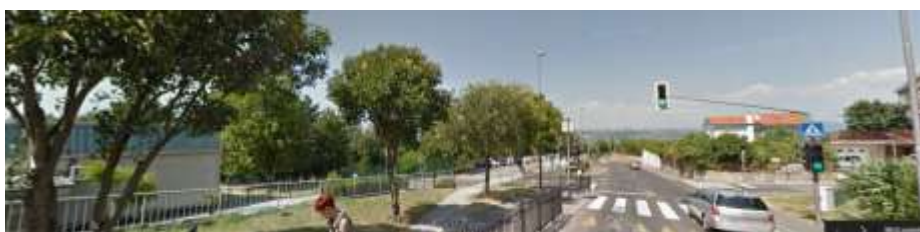
Ulica Vena Piona – križišče pred šolo in semaforiziran prenos za pešes talno oviro za umirjanje prometa.