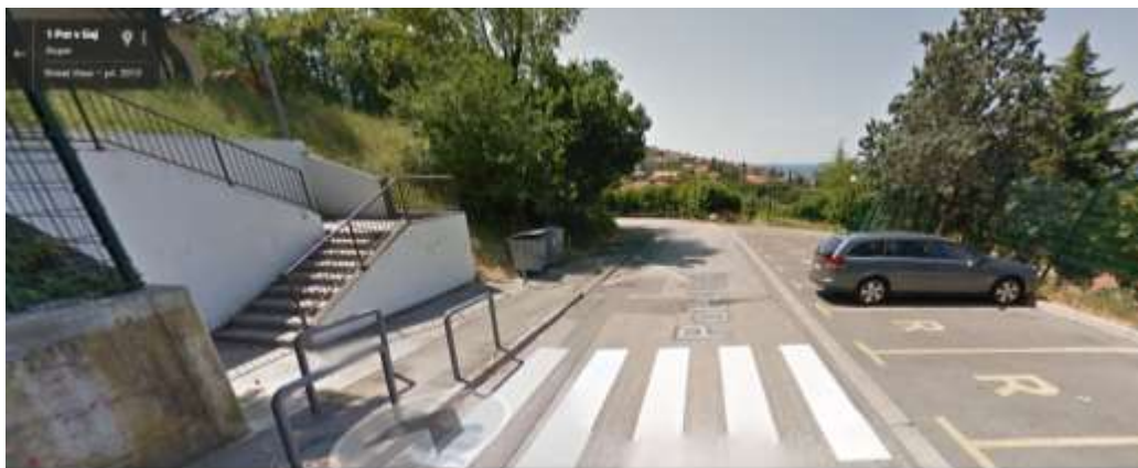
Pot v gaj –