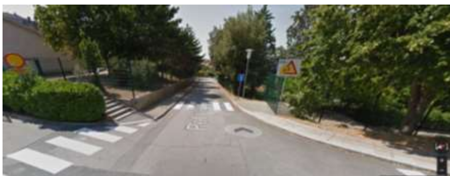
Pot v gaj