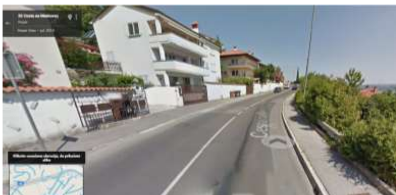
Cesta na Markovec

Oba odseka sta na zemljevidu šolskega okoliša označena z rdečo barvo.