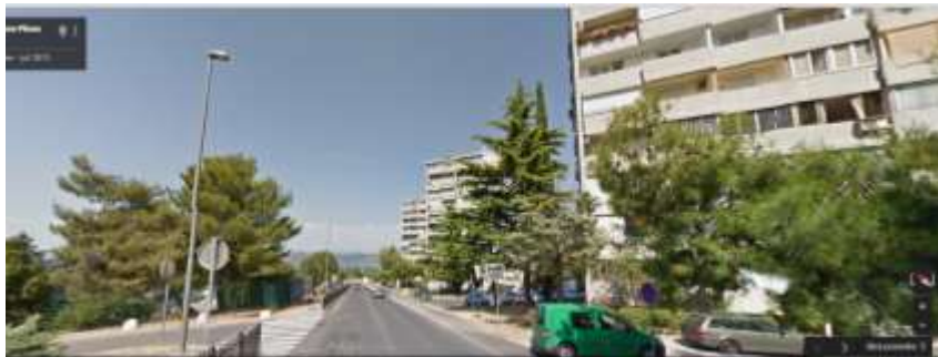
Ulica Vena Piona

označeni z zeleno barvo. Označene poti so opremljene s primerno prometno signalizacijo, imajo dovolj varnih prehodov za pešce in tudi cestne ovire za zmanjšanje hitrosti vozil v naselju.