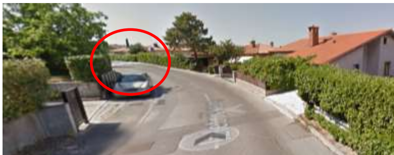
Prehod za pešce na Izletniški poti

ter prehod za pešce na Izletniški poti (tukaj se vključujejo učenci iz Podbrežne poti), ki je lociran na nepreglednem ovinku in je prihod učencev iz stopnic zakrit z živo mejo.